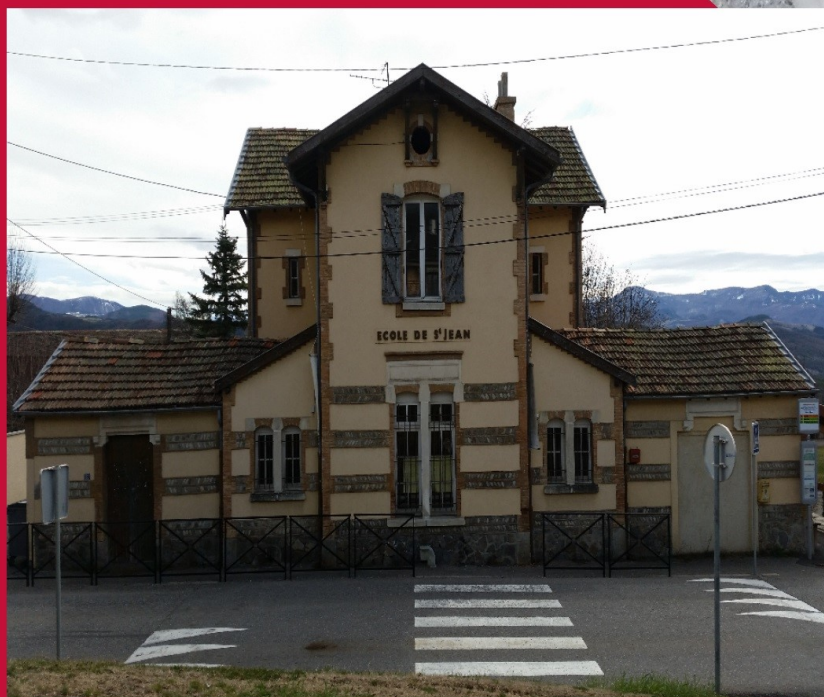
Ecole Calandreta Gapiana Quartier Saint Jean 05000 Gap

SOYONS ACTEUR DE LA SAUVEGARDE DE NOTRE PATRIMOINE