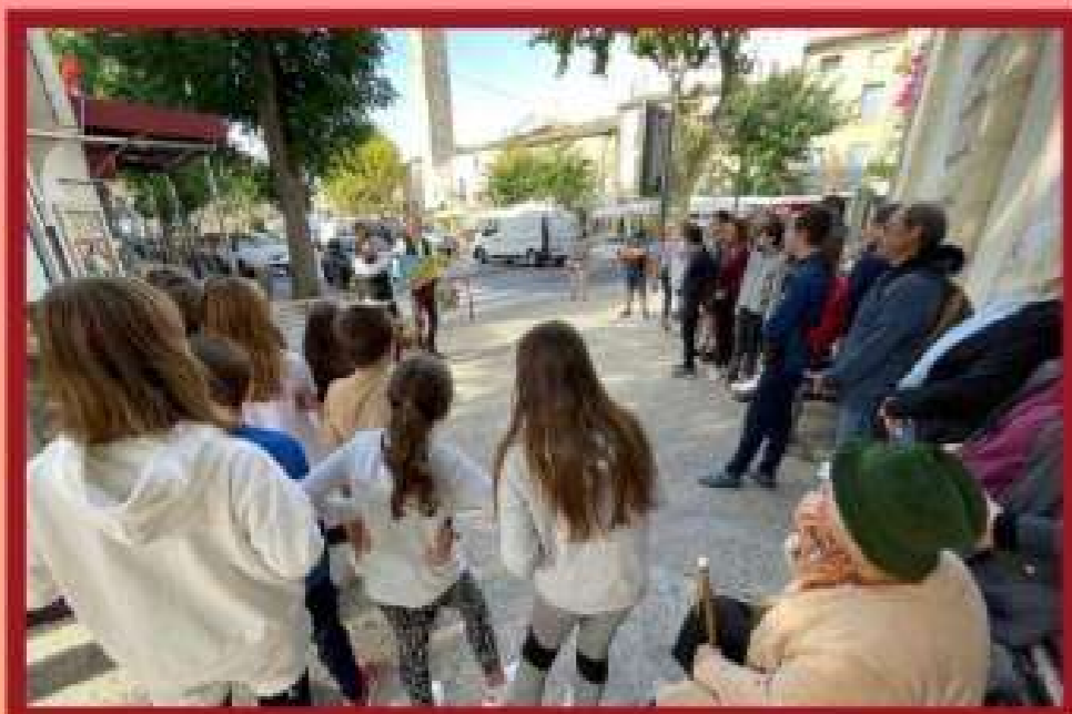
Convivència e paratge

Le Domaine du Moulinet est membre de l'association nationale des villages de gîtes: ce label propose des hébergements et des équipements de qualité avec un espace extérieur privatif (meublé de tourisme ★★★)