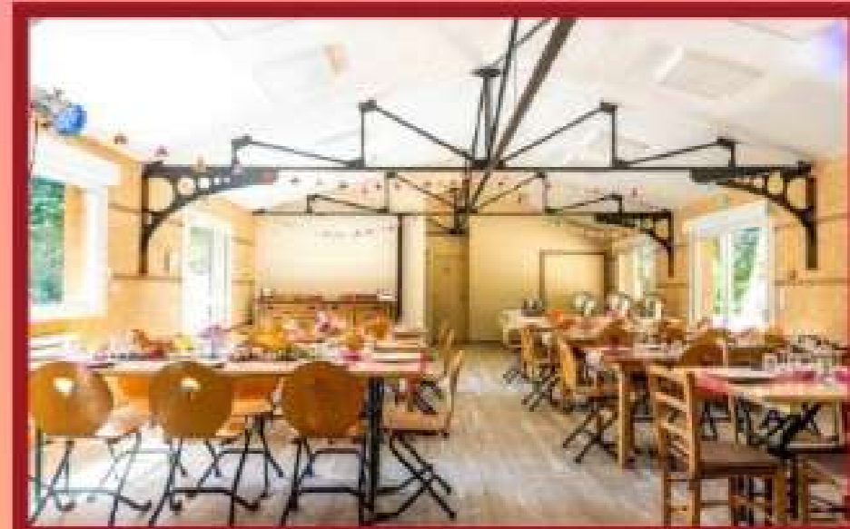
Luòc de vida