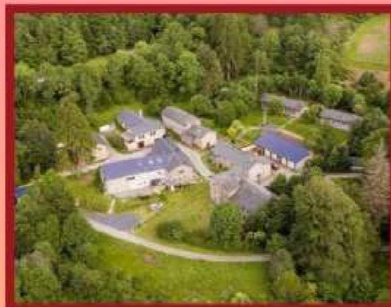
Domeni del Molinet